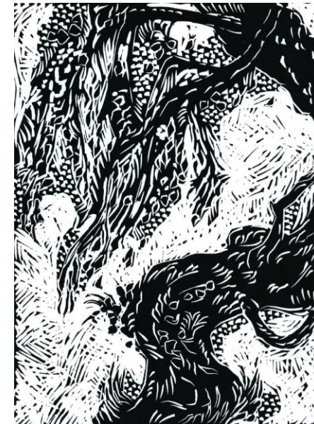
«L'arbre fleurissant»: gravure sur bois de Bruce HARRIS, reproduction interdite